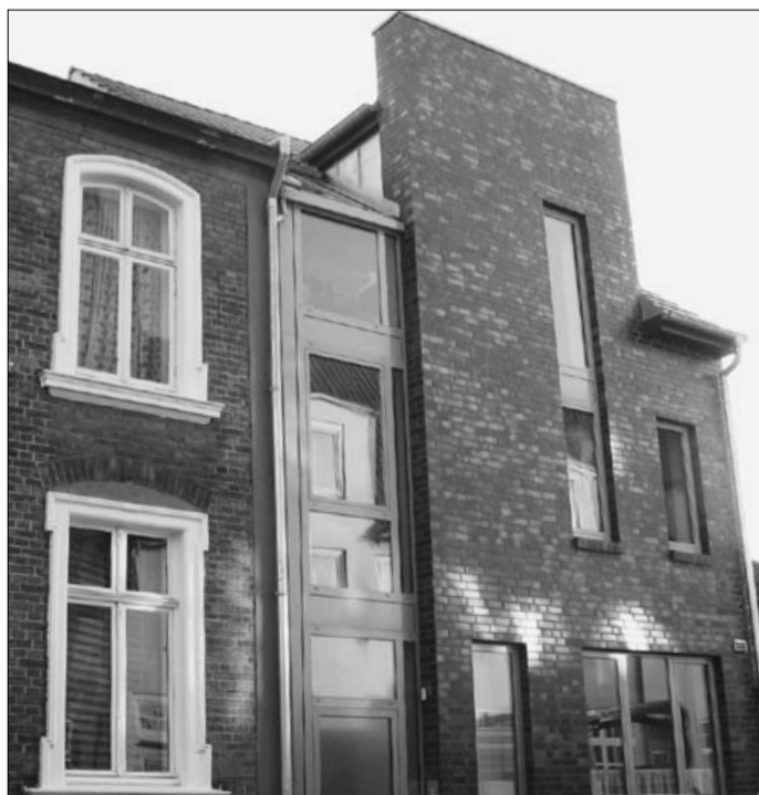
Ein Fensterband grenzt die moderne Fassade vom Nachbarhaus ab