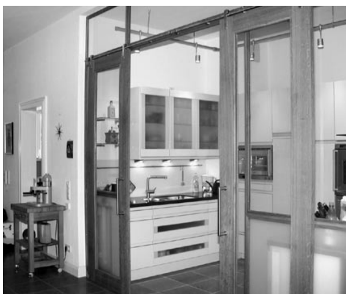
Die moderne Küche ist durch eine Glaswand von der Diele abgetrennt

Redaktion: bfö Büro für Öffentlichkeitsarbeit Christopher Cohen