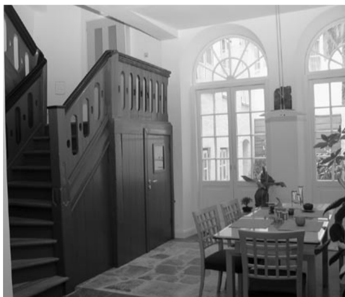
Mittelpunkt des täglichen Lebens ist die große Diele mit Essplatz. Die offene Treppenanlage stammt aus der Zeit um 1800

Die meisten Möbel stammen noch aus der alten 60-qm-Wohnung in der Huxstraße. „Sie haben aber nur für anderthalb