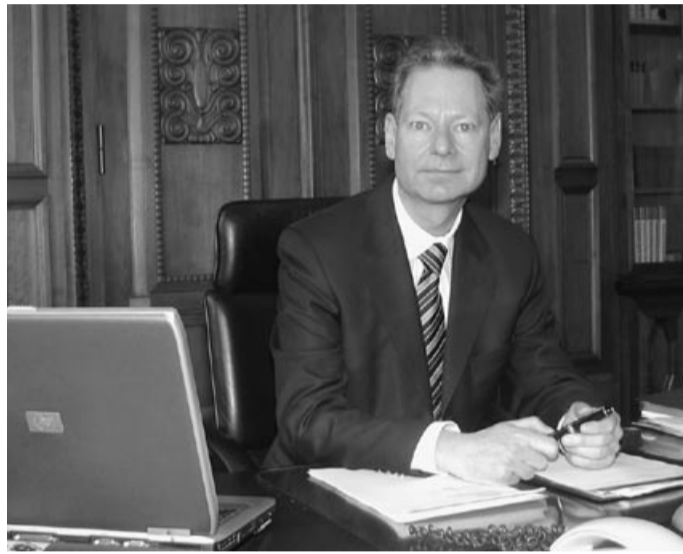
Freut sich über grüne Farbtupfer in der Altstadt: Senator Thorsten Geißler

In der Altstadt gibt es aber auch nach wie vor eine Anzahl von versiegelten Flächen, deren Böden entsiegelt und auf denen Bäume gepflanzt werden könnten, natürlich unter Beachtung der Stadtgeschichte und in enger Zusammenarbeit mit der Stadtplanung und der Denkmalpflege. Wir wollen an der geschlossenen Blockrandbebauung der Altstadt nichts ändern. Ich möchte mit meinen Fachleuten aber daran arbeiten, dass wir die Zahl der Farbtupfer noch erhöhen. Ich habe selbst einige Jahre in der Innenstadt gelebt und für mich gehört das Grün zur Lebensqualität.